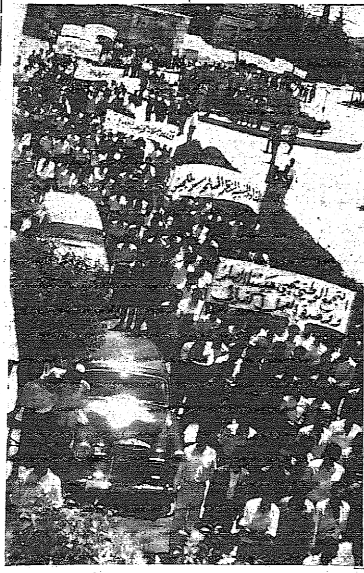
جانب من مسيرة اريد في ه حزيران